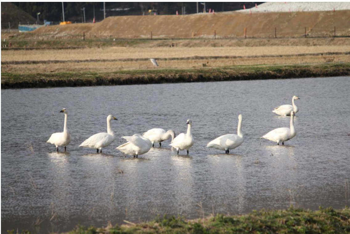
図3 ふゆみずたんぼで休息するコハクチョウ (2011年2月26日 若狭町鳥浜)