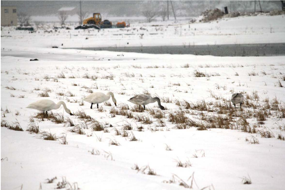
図2 雪上に出た二番穂を採餌するコハクチョウ (2011年1月7日 若狭町鳥浜)