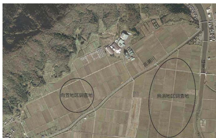
図1 調査地位置図

三方湖南部の若狭町鳥浜地区、向笠地区（図1）のふゆみずたんぼにおいて、平成22年11月21日から平成23年3月18日までの期間中、主に午前8時30分前後の時間帯に確認されたコハクチョウの個体数を8～18倍の双眼鏡を用いて計数した。