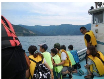
磯めぐり乗船体験