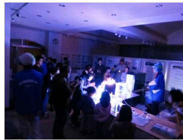
夜の館内探検ツアー