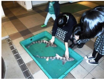
サメのタッチプール