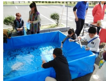
しじみつまみ大会