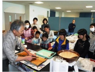
はんぺん作り体験