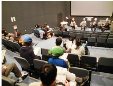
マリンコンサート

※来館者 10月29日(土) 1,897人、10月30日(日) 2,120人 合計 4,017人