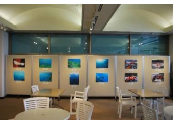
福井の海に親しむ会 写真展 「スノーケリングで見られる若狭の海の美しい景観と生きものたち」