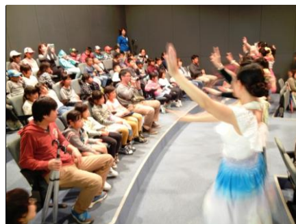
フラダンスショー