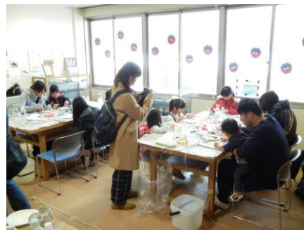
人工イクラドーム作り