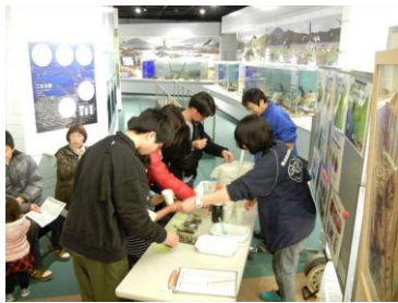
海藻のお話・試食