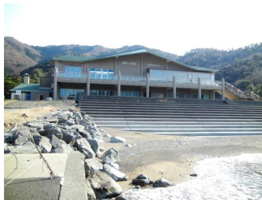
海側から見た海浜自然センター