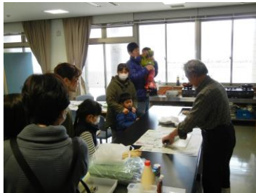
魚の調理・試食体験