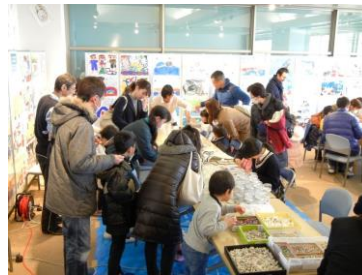
スノードームクラフト