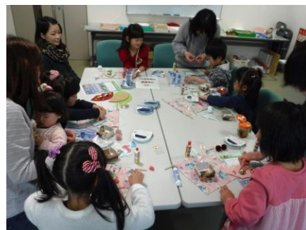
貝雛タペストリー作り