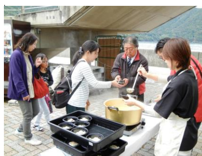
タイ雑炊ふるまい