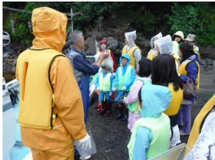
磯めぐり乗船体験

※来館者 5月13日(土)2,242人、5月14日(日)3,886人 合計 6,128人