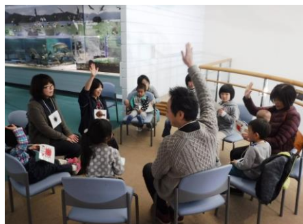
海の生きものバスケット

③内 容 ゲーム(海の生き物バスケット)・クラフト(貝雛タペストリー作り) 90人