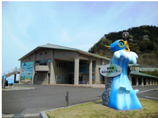
国道側から見た海浜自然センター

また、平成17年には、三方五湖がラムサール条約湿地に登録されたことにより、従来の若狭の海を中心とした展示に加え、三方五湖の自然環境や自然再生活動を紹介するなど、三方五湖のビジターセンターとしての役割を担ってきました。平成26年4月には「うみ（海湖）のビジターセンター」としてリニューアルオープンし、嶺南地域の自然環境保全の重要性を紹介するとともに、学ぶ普及啓発施設として皆様にご利用いただくことを目的に運営しています。