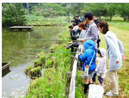
ザリガニ釣り体験