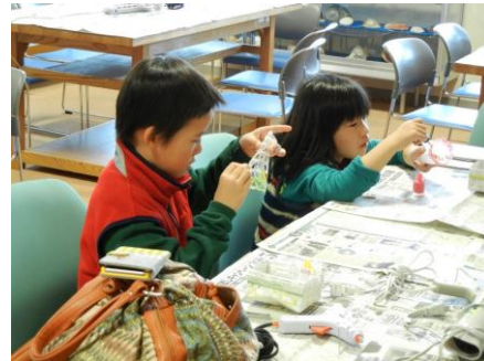
海のクリスマスツリー