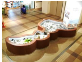
福井の海にタッチしよう