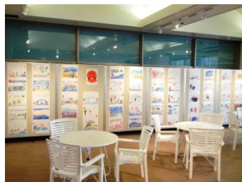
ほのぼの幼児絵画展 若狭町梅の里・明倫保育園、小浜市やまなみ保育園