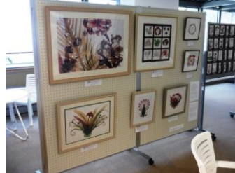
海藻おしば作品展