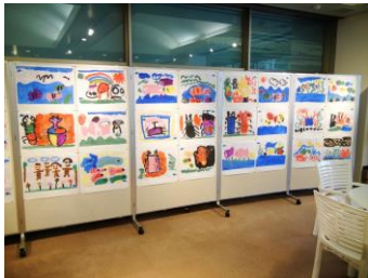
ほのぼの幼児絵画展 小浜市浜っ子こども園