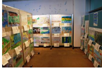
「昔の水辺の風景」絵画作品展