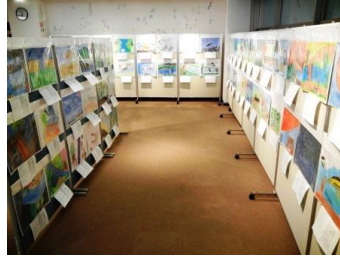
「昔の水辺の風景」絵画作品展