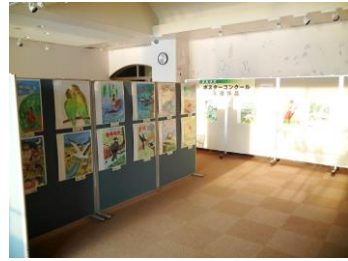
平成29年度愛鳥週間用ポスター原画コンクール入賞作品展