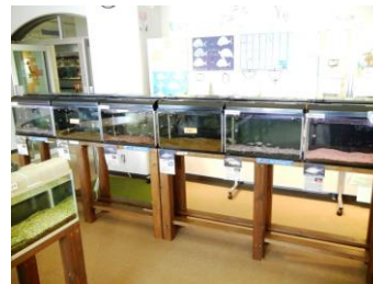
企画展「魚の世界も大変だ！～川や湖の魚が教えてくれること～」