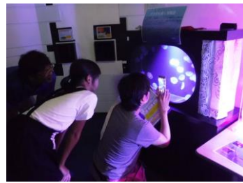
小さなミズクラゲ展