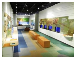
若狭湾の生きものたち