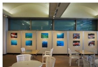
福井の海に親しむ会 写真展 「スノーケリングで見られる若狭の海の美しい景観と生きものたち」