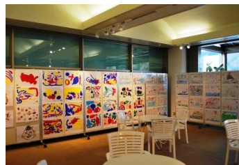
ほのぼのの幼児絵画展