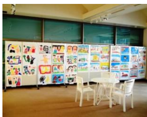
ほのぼの幼児絵画展