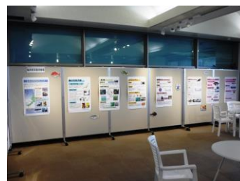
福井県の水産研究