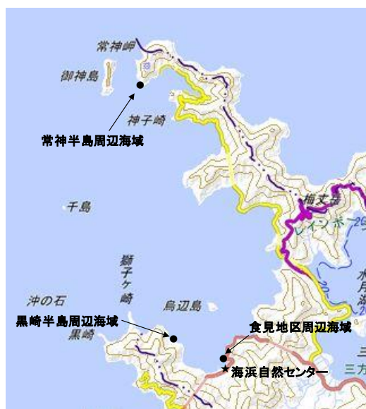
図3 魚類相調査地点

本調査は、平成23年度より世久見湾奥の海浜自然センター北側に隣接する遊歩道周辺海域（図3の食見地区周辺海域）、海域公園地区4号に指定される黒崎半島の椎出から岡鶴地先にかけての海域（図3の黒崎半島周辺海域）および海域公園地区1号に指定される常神半島周辺海域（図3の常神半島周辺海域）において実施している。今年度も、スノーケリングリーダーの協力で、令和2年5月から3年2月にかけて計9回、スノーケリングで目視により確認された魚種を記録した。調査時の水温と調査人数、調査場所については、表5に示した。