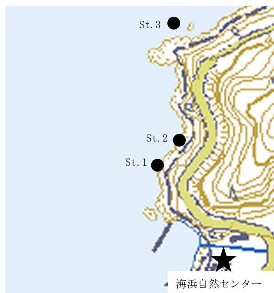
図2 生物相調査場所

3m 四方のコドラートを各調査地点(図2の St.1-3)に1箇所ずつ設置し、スノーケリングによる目視観察によって、コドラート内に出現した無脊椎動物(軟体動物、甲殻類、棘皮動物、環形動物、刺胞動物)、魚類について記録した。目視観察は、3人で1コドラートにつき20分間行い、表2の基準にしたがって記録した。いずれの分類群についても微小な個体や岩の下、割れ目の奥などに隠れているものは調査対象から除外した。