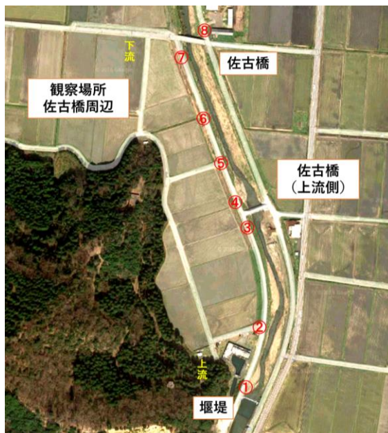
図4 サケ遡上調査地点

今年度の調査は令和2年10月2日より12月12日まで、若狭町はす川の佐古橋から落合橋までの間に8か所の定点を設け(図4参照)、目視により遡上するサケを観察し、観察された数を記録した。また、各地点で見られたサケの死骸についても数を記録した。